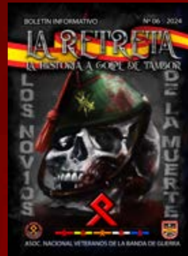
PORTADA ILUSTRACIÓN DEIVI DEPALMA 014